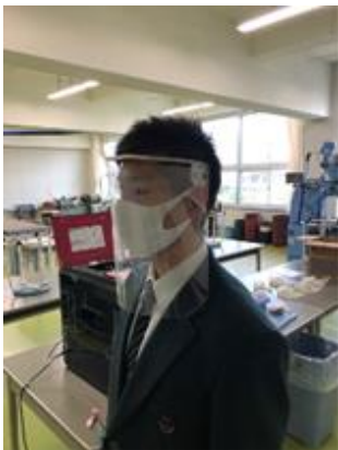
試作品で装着感を確かめました

現在の状況下において、地域の方々が少しでも安心して生活が出来ることを願いながら、製作しました。今後も総合高校の高校生としてできることに取り組んでいきます。