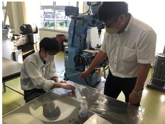
シールド部分を消毒