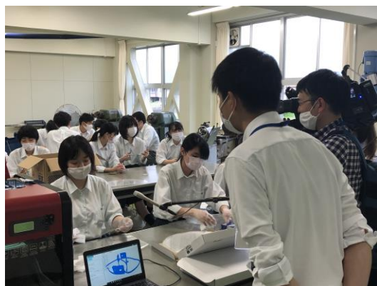
最終仕上げを4系列の生徒で行いました